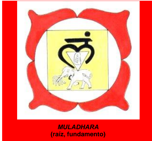
MULADHARA (raíz, fundamento)

PRIMERO (Centro coccígeo): Energía física y voluntad de vivir.