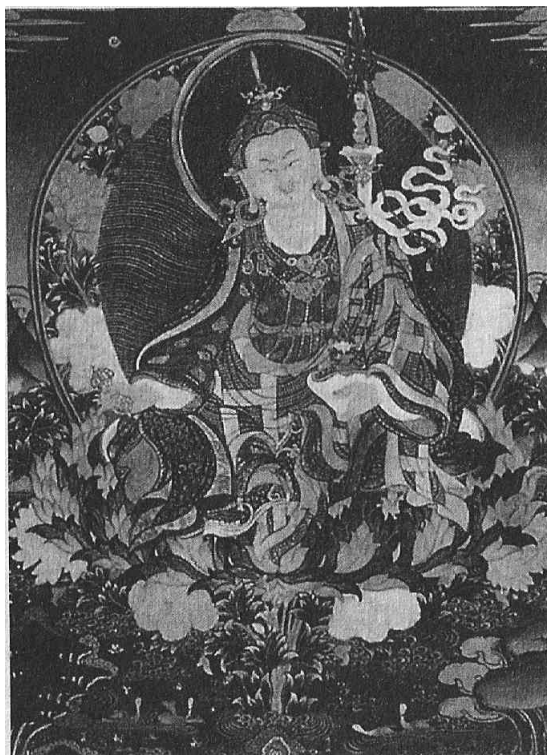
Padmasambhava, o guru Rimpoché

Su ropa desprende luz. La prenda blanca y la túnica roja interiores simbolizan la iluminación del bodhisattva, que ayuda a todos los seres que sufren en este mundo. La túnica externa azul simboliza la perfección de los logros esotéricos, y lleva puesto el chal del monje perfecto. La capa de brocado es un símbolo de que todas las enseñanzas religiosas están unidas en la verdad universal.