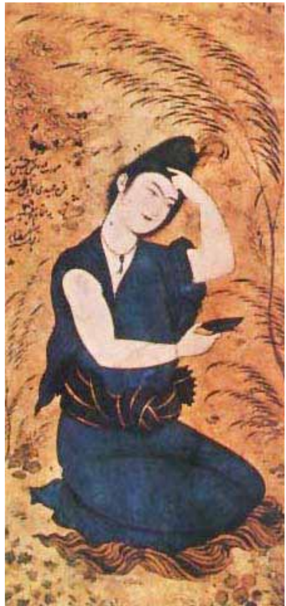
Derviche con copa. (Rezza Abbasi, s. XVIII, Ispahán)