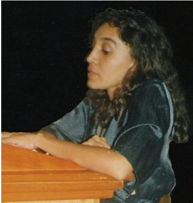
Cuartel Clemencia Tariffa