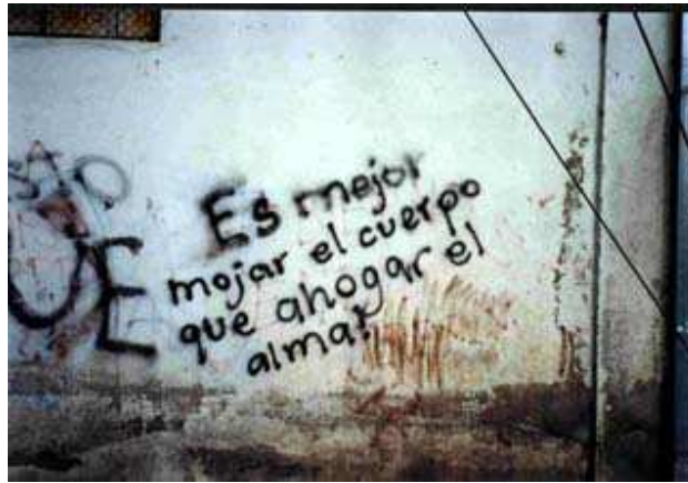
(Es mejor mojar el cuerpo que ahogar el alma)