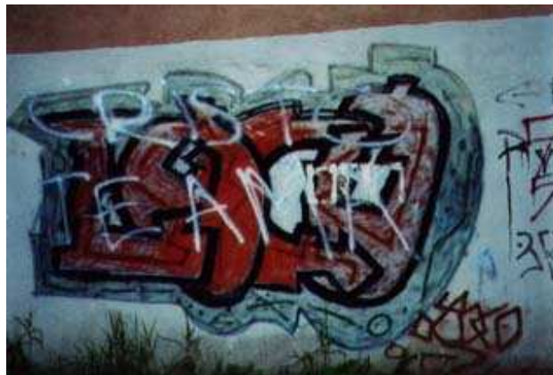
(Cristo te ama)