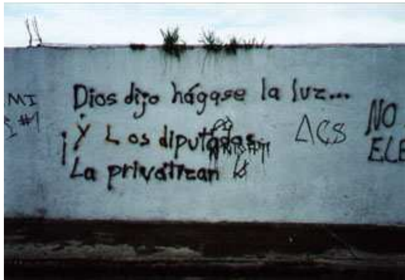
(Dios dijo hágase la luz... y los diputados la privatizan)