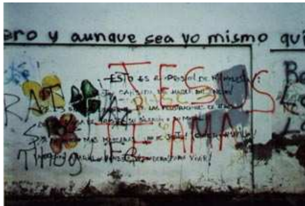
(Jesús te ama)

En estos graffitis se expone un poco el tema religioso, ya que los graffitis de encima tocan el tema Religioso.