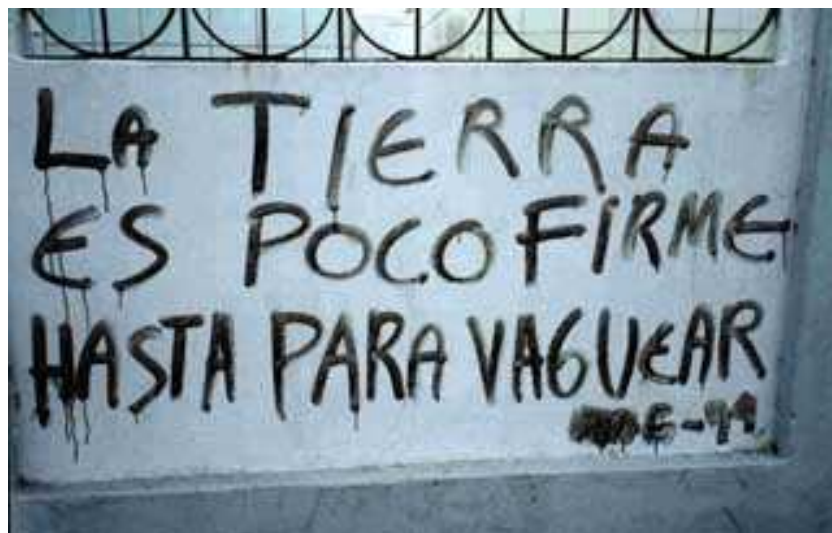
(La tierra es poco firme hasta para vaguear)

En los siguientes graffitis se muestra un poco de de poesía sobre temas realmente fuera de lo común... El ocio y el tomado.