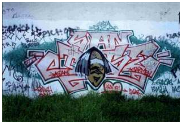
(San José, Costa Rica)

Este último graffiti representa muy bien la realidad de San José. Es un muro que dice Costa Rica, San José y está muy artístico. Utiliza un lenguaje verbal icónico y se puede observar en el dibujo como los otros graffitis no se escriben encima del mismo, sino que a manera de respecto se hacen a los lados.