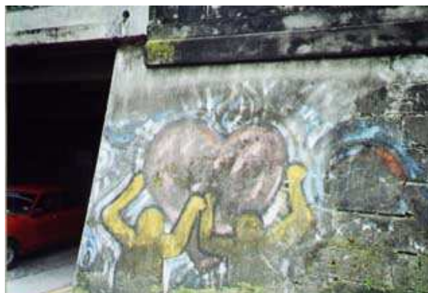
(¿Union?, ¿Libertad? ¿Amor?)

Los siguientes 4 graffitis, presentan elementos muy artísticos que pueden existir en los graffitis. Estos dibujos parecen ser hechos por verdaderos artistas. Utilizan el lenguaje icónico para expresar sus ideas.