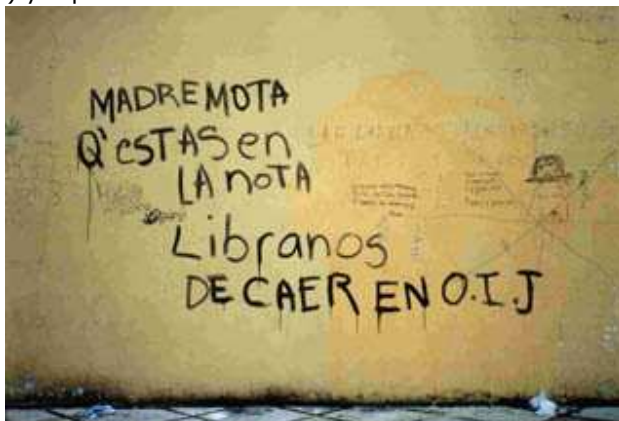
(Madre mota, q'estás en la nota, libranos de caer en OIJ)

En el siguiente graffiti se puede observar el uso del lenguaje verbal sobre un muro. El graffiti contiene un estilo de poesía (por su rima) y representa una idea sobre el consumo de las drogas.