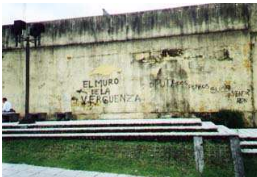
(El muro de la verguenza)

En este graffiti también se puede observar el uso del lenguaje verbal para demostrar el estado de los muros del museo nacional.