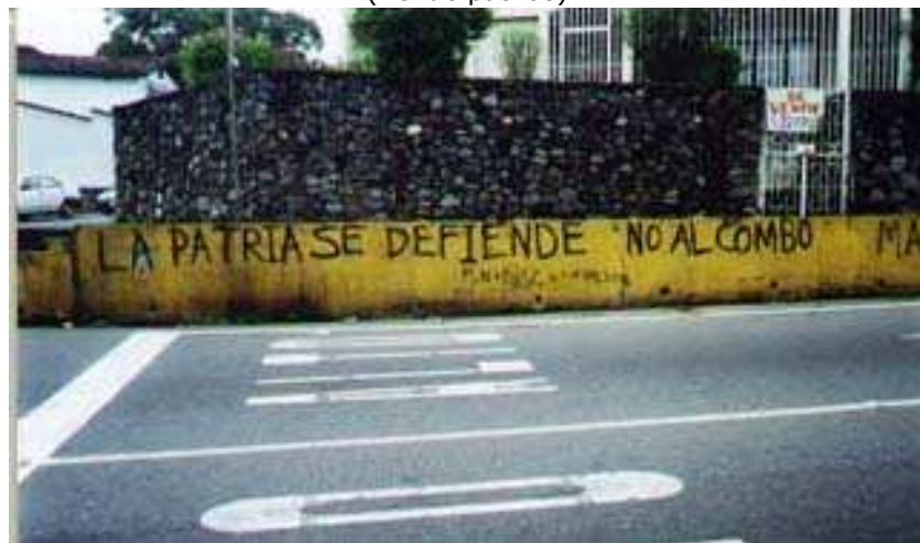
(La patria se defiende No al combo)