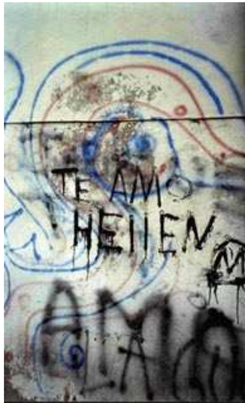
(Te amo Hellen)