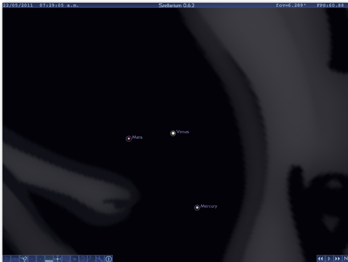
(Mercurio, Venus, Marte) en conjunción

La llave del demonio de Ambal o virgen del Apocalipsis, es la señal que dará paso a la liberación de un demonio sobre la Tierra este tendrá por misión perseguir a la humanidad hasta el advenimiento del Mesías . Es un dios infernal muy poderoso, pues tiene gran control sobre las fuerzas de la naturaleza y utiliza estas fuerzas para torturar, engañar y poner a prueba a la humanidad.