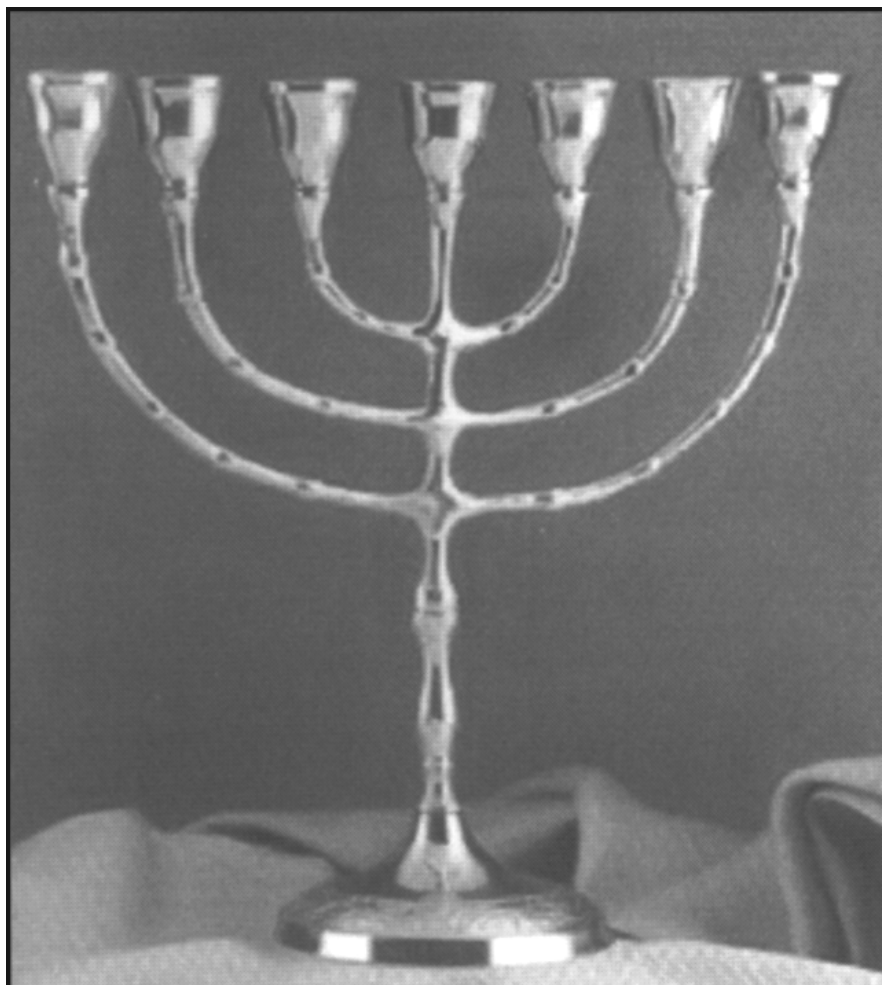
Candelabro de siete brazos

Juan continúa su descripción y ahora resalta al personaje céntrico de toda la revelación que recibe: y en medio de los candeleros vi a uno semejante al Hijo del Hombre (v. 13). Este es el modo favorito como Cristo se refería de sí mismo, aunque en ocasiones Jesús no negó el uso apropiado de “Hijo de Dios” (Juan 10:36; comp. Mar. 14:61, 62). El origen del nombre se halla en Daniel 7:13 donde se describe la presentación al “Anciano de Días” de “un Hijo del Hombre” que venía “en las nubes del cielo”. Esto se debe tomar como una referencia al Mesías celestial que a la vez es humano. Hay diferentes opiniones en cuanto al significado de esta designación. En el texto de Juan, sin embargo, es claro que el que habla no es otro que el Cristo exaltado.