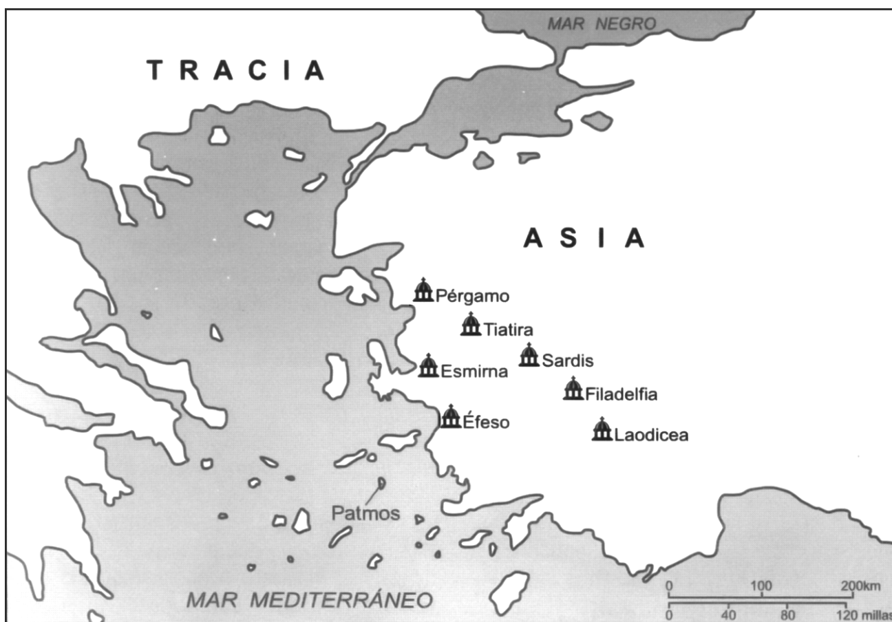
Las siete Iglesias del Apocalipsis