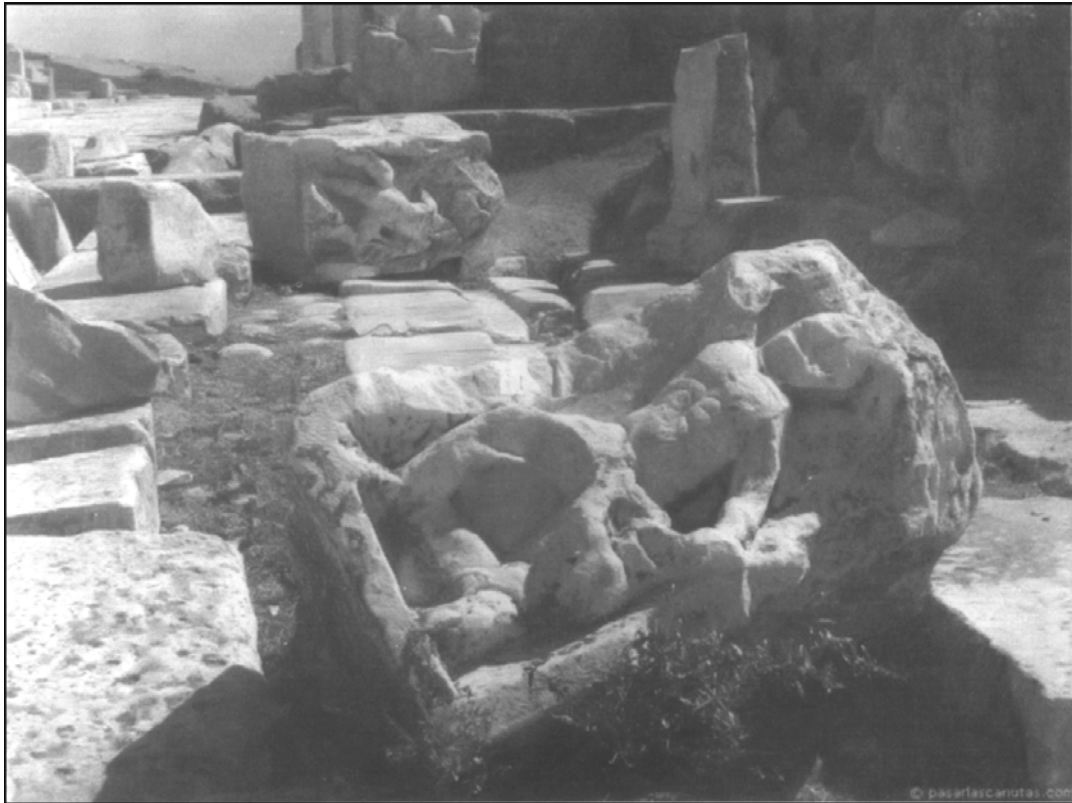
Ruinas de Laodicea

El texto expone la verdadera y triste condición de esta iglesia (v. 17b). La soberbia es base de la ignorancia. El Señor replica en el diálogo diciendo: y no sabes . Lo que creen de sí mismos no corresponde con la realidad; Cristo sí sabe cómo era esta iglesia. Es muy fácil que los humanos se engañen a sí mismos, pero es imposible engañar a Cristo, porque es Dios (comp. Gál. 6:7).