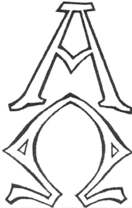
Alfa y Omega

Segundo, el Señor Dios es uno de los títulos favoritos que Juan emplea para referirse a la deidad en Apocalipsis (comp. 4:8; 11:17; 15:3; 19:6; 21:22). Particularmente, este nombre en forma de par ( Señor Dios ) también enfoca la soberanía de su señorío que sujeta a todo cuanto ocurre en el curso entero de la historia humana. Este nombre anima a los creyentes de Asia que están próximos a sufrir persecución por causa de su fe en Cristo.