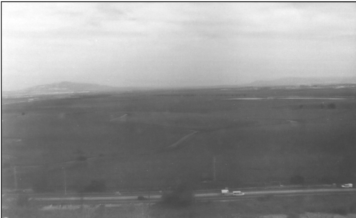
Valle de Armagedón

b. Hay una segunda visión: Aparición de los siete ángeles con las siete plagas, 15:5–8. Surge ahora una segunda escena aún más impresionante. Se abre de nuevo la puerta del templo celestial (v. 5; comp. 11:19), y salen de allí siete ángeles con vestiduras limpias y resplandecientes, y con cintos de oro (v. 6). El hecho de que estos siete mensajeros angelicales provengan del santuario celestial da a entender que los juicios que han de pronunciar son expresiones de la mismísima justa y santa voluntad divina.