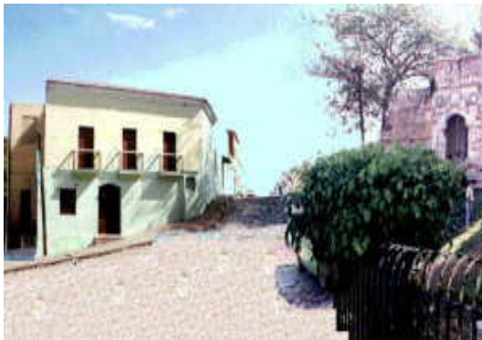
Fachada Noreste de la Logia Esperanza

Benemérita y Respetable Logia Esperanza No. 9, Inc. Cuna del Himno Nacional Dominicano