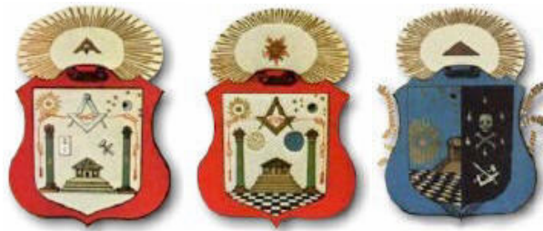
Heraldos de los Tres Grados Simbólicos

no es órgano de ningún partido político ni agrupación social. 3 ro .) Que la Masonería o la Orden Masónica prohíbe toda discusión política o religiosa durante las reuniones de sus miembros.