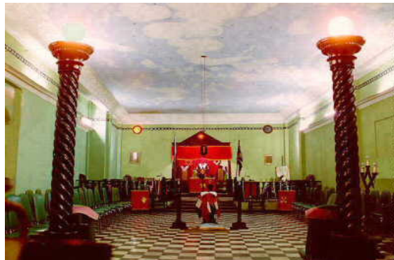
Templo de la Logia Esperanza