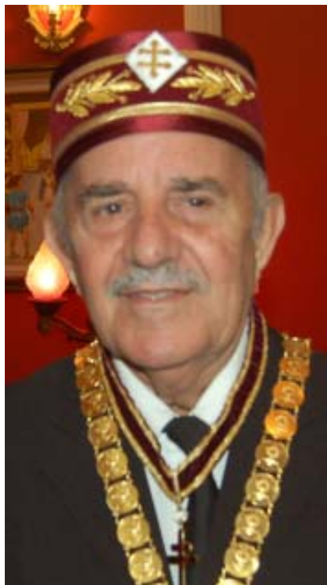
Bernardino Coelho Pontes - Grande Secretário de Relações Exteriores

“A todos esses irmãos eu só posso dizer o meu muito obrigado por estarmos juntos e unidos com os mesmos objetivos”