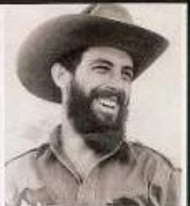
Notables. Camilo Cienfuegos, Hugo Chávez, Evo Morales y Walt Disney. Todos se relacionaron con el enigma.