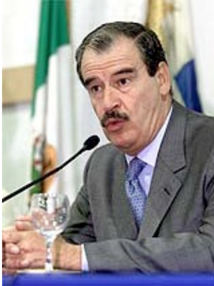
Cuestionado Presidente Mexicano