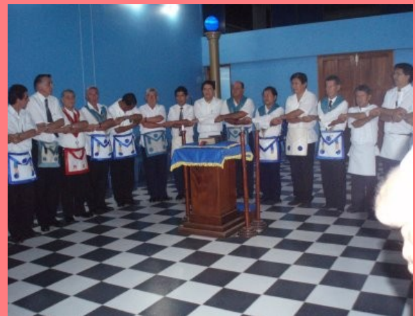
CADENA FRATERNAL DE LA R.:L.:S.: CORDIL- LERA ESCALERA No. 06