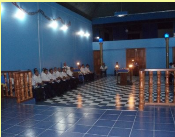
Taller de la R.:L.:S.: Cordillera Escalera No. 06 del valle de Tarapoto

El valle de Tarapoto es una demostracion de lo que pueden y hacen los masones cuando trabajan en paz y armonia dentro de un linea humanista y progresista. Nuestro saludo por su excelente trabajo a la R.:L.:S.: Cordillera Escalera No. 06.