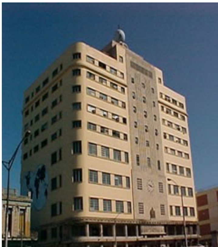
Edificio del Gran Templo Nacional Masónico, Ave. Salvador Allende 508, Ciudad de La Habana.