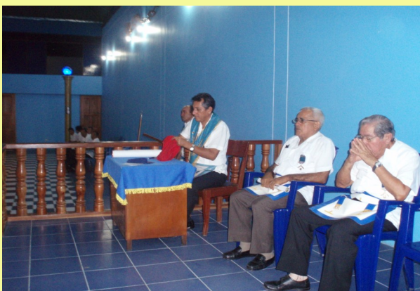
HH.: en el oriente del Taller