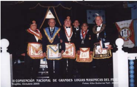
Grandes maestros de la Diversas Obediencias del Perú en el templo de Trujillo

NOTI-FENIX. Los días 29, 30 y 31 de Octubre en la ciudad de Trujillo, en la Región La Libertad a 500 Km. de la capital de Perú, la Confederación de Grandes Logias Masónicas del Perú (CONFEGLOMAS-PERU) celebró su II Convención Nacional,