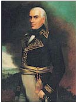
Francisco de Miranda

En Homenaje los forjadores de la historia y del progreso de la humanidad, dedicamos este pequeño rincón solo a un pequeño grupo de ellos