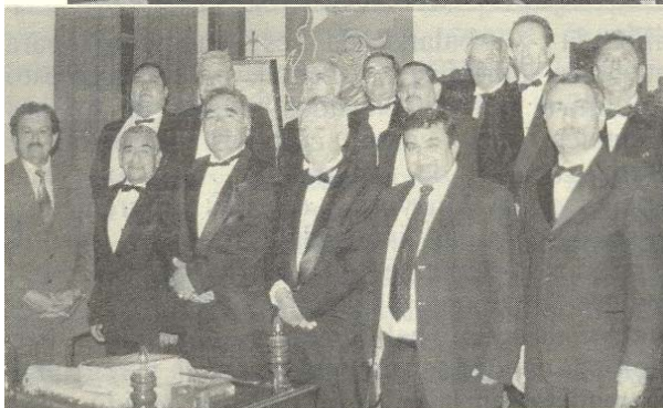
Sup.:Con.: en Tuxtla Gutiérrez Chis.

Desde la Republica de Mexico no llega el saludo del Supremo Consejo del Estado de Chiapas, en Tuxtla Gutierrez.