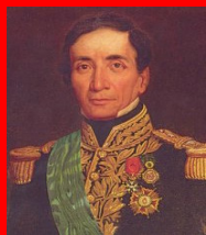
H.: SANTA CRUZ