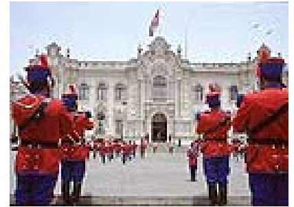
El Palacio de Gobierno -Lima