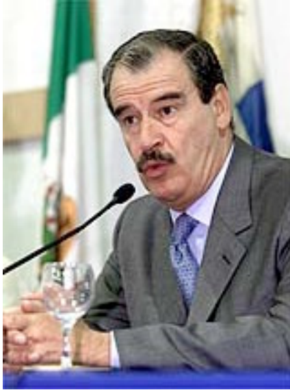
Cuestionado Presidente Mexicano