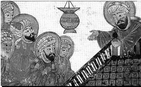
Mahoma y sus discípulos.

a) ¿Qué importancia tuvo este personaje y para quienes?