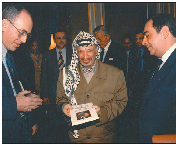
1997. Fred Halliday (izq.) y Yassir Arafat con el libro El islam y el mito del enfrentamiento en árabe .

La revolución iraní tiene mucho más apoyo que la revolución cubana en Cuba. Después de 20 años de revolución, en Irán, si hay elecciones, tienen un 60 % de apoyo, en cambio Fidel Castro con 40 años de revolución no puede hacer lo mismo. Hay mucho más libertad en Irán que en Cuba. Más diversidad política.