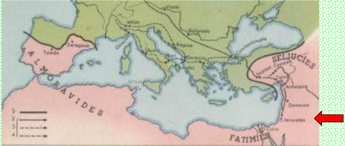
Dominio Musulmán antes de las Cruzadas: Divididos en Almorávides, Fatimies y Selyeúcidas