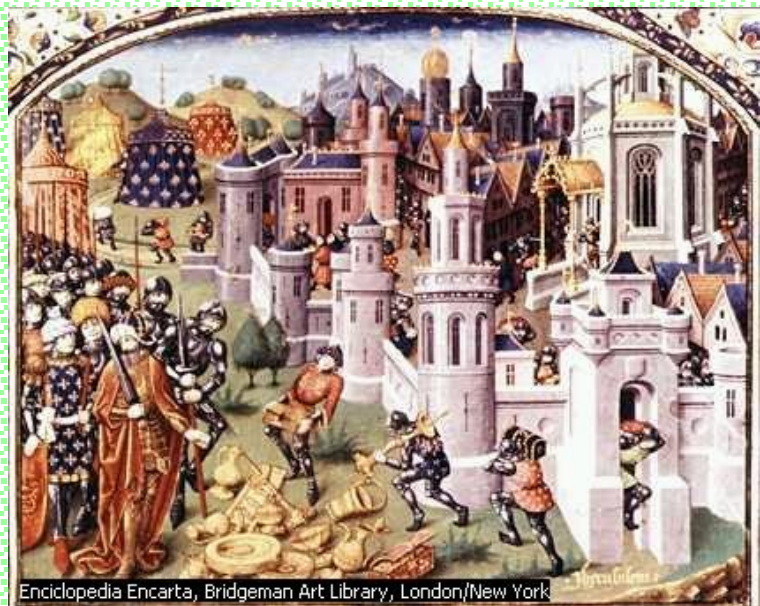
Enciclopedia Encarta, Bridgeman Art Library, London/New York

El Reino se organizó según modelos feudales, su defensa inicialmente era por los cruzados, pero luego reforzada por las Ordenes Militares, es especial el Temple (fundado en 1118).