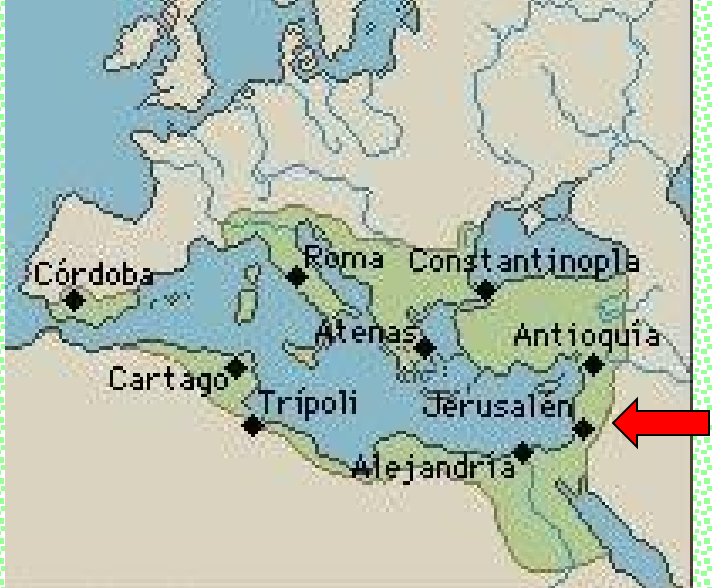
Imperio Romano (sólo de Oriente): Capital Constantinopla (550 d.C)