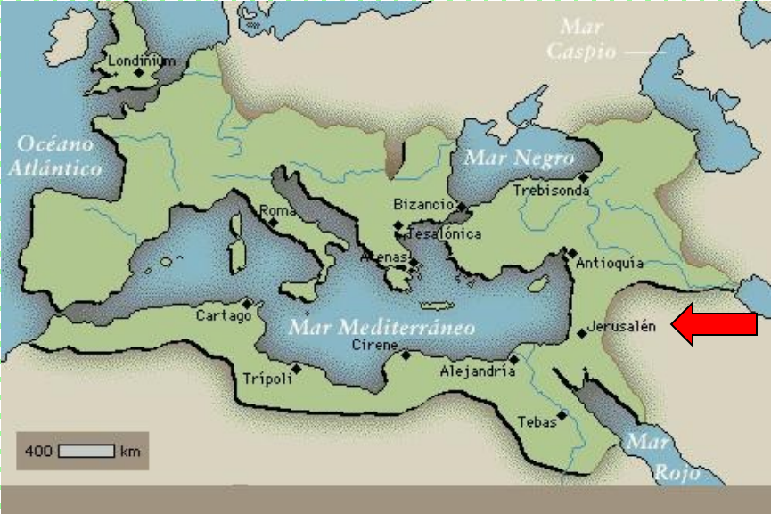
Imperio Romano: Capital Roma (117 d.C)