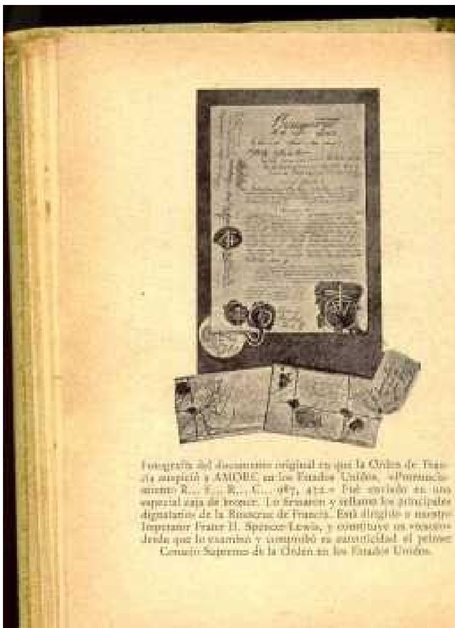
Fotografía del "Manifiesto R.C.R.F. 987.432"

Afortunadamente para los historiadores y estudiosos, la AMORC dió permiso a una editorial española, la Editorial Roch, situada en Barcelona, cuyo domicilio social y talleres en el año 1934 estaban situados en la calle Aragón nº 118, para publicar varias obras de la AMORC en español, y una de esas obras fue, precisamente, el "MANUAL ROSACRUZ, en cuya página 24 también aparece ese documento, por lo que, si bien es cierto que el "importante" documento nunca llegó a ser examinado personalmente por nadie, al menos se conserva su imagen fotográfica en dos publicaciones. (nota 3)