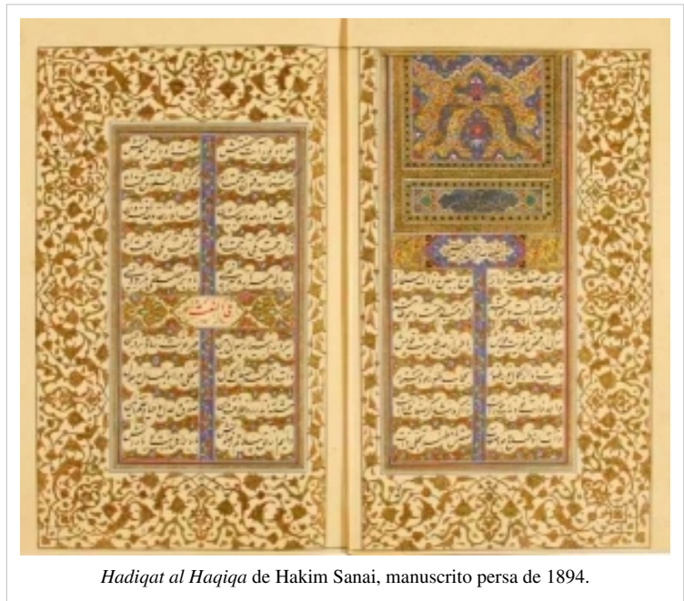
Hadiqat al Haqiqa de Hakim Sanai, manuscrito persa de 1894.

Acorde a Stephenson, los temas de los 10 libros o capítulos que, en sus versiones más extensas, constituyen El jardín amurallado de la verdad son: «el primer libro», en alabanza de Dios, y sobre todo de su unidad; «el segundo», en alabanza al Profeta Muhammad; el «tercero», sobre la comprensión; «el cuarto», sobre el conocimiento; «el quinto», del amor, el amante, y el amado; «el sexto», sobre la negligencia o desatención; «el séptimo», sobre amigos y enemigos, «el octavo», sobre la revolución de los cielos; «el noveno», en alabanza del emperador Shâhjahân y «el décimo», sobre el conjunto de toda la obra. Hay que aclarar sin embargo que, según sea la fecha de edición del