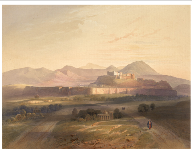
La antigua Gazni, ciudad de Hakim Sanai , en una litografía del siglo XIX.

En los primeros años de la XIIª centuria Sanai deja Gazni, marchando a la región de Jorasán, fuera de los territorios gobernados por los gahnávidas y peregrina de una ciudad a otra, estableciendo contacto con estudiosos de la clase religiosa, tanto del clero musulmán como sufíes. Esta renuncia a la vida de poeta cortesano, es relatada en algunas fuentes como consecuencia de la singular conversión espiritual que vivió tras el encuentro con Lai Khur , [1][2][10][11]