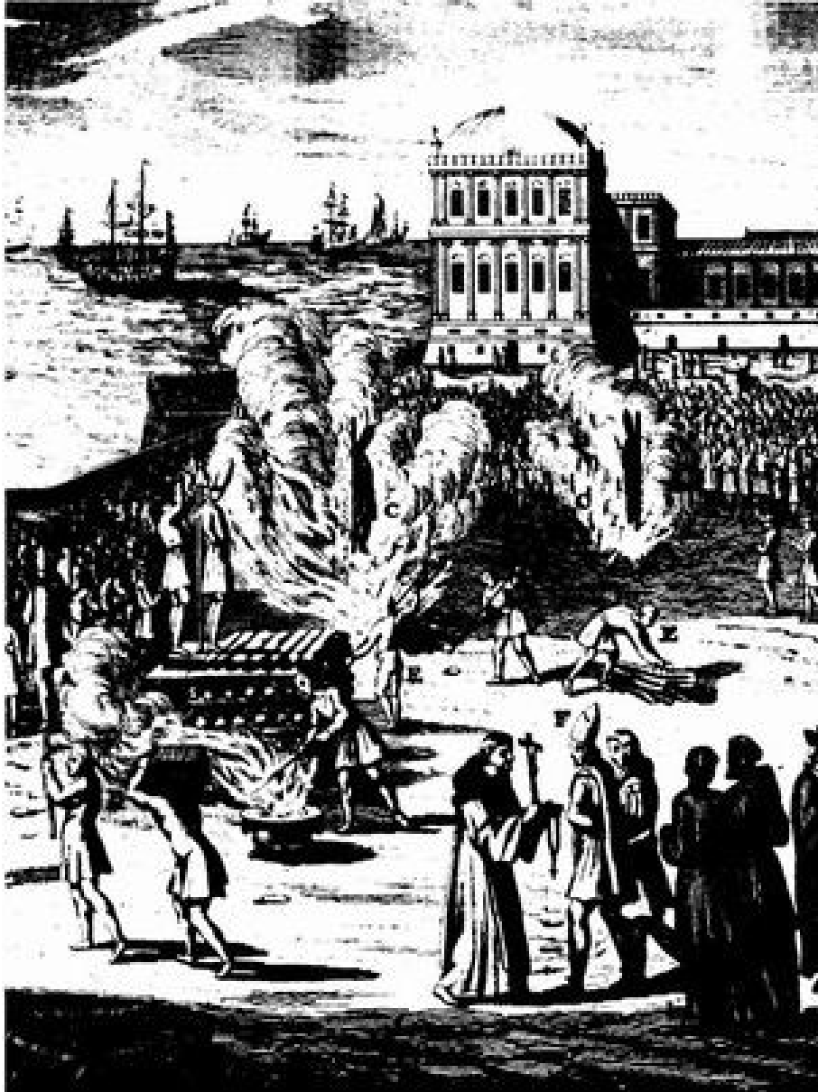
Judíos condenados a la hoguera por la Inquisición. Las víctimas llevan la cabeza cubierta con la característica coraza. Grabado de Heilige Zeremonien (Zurich, 1748).