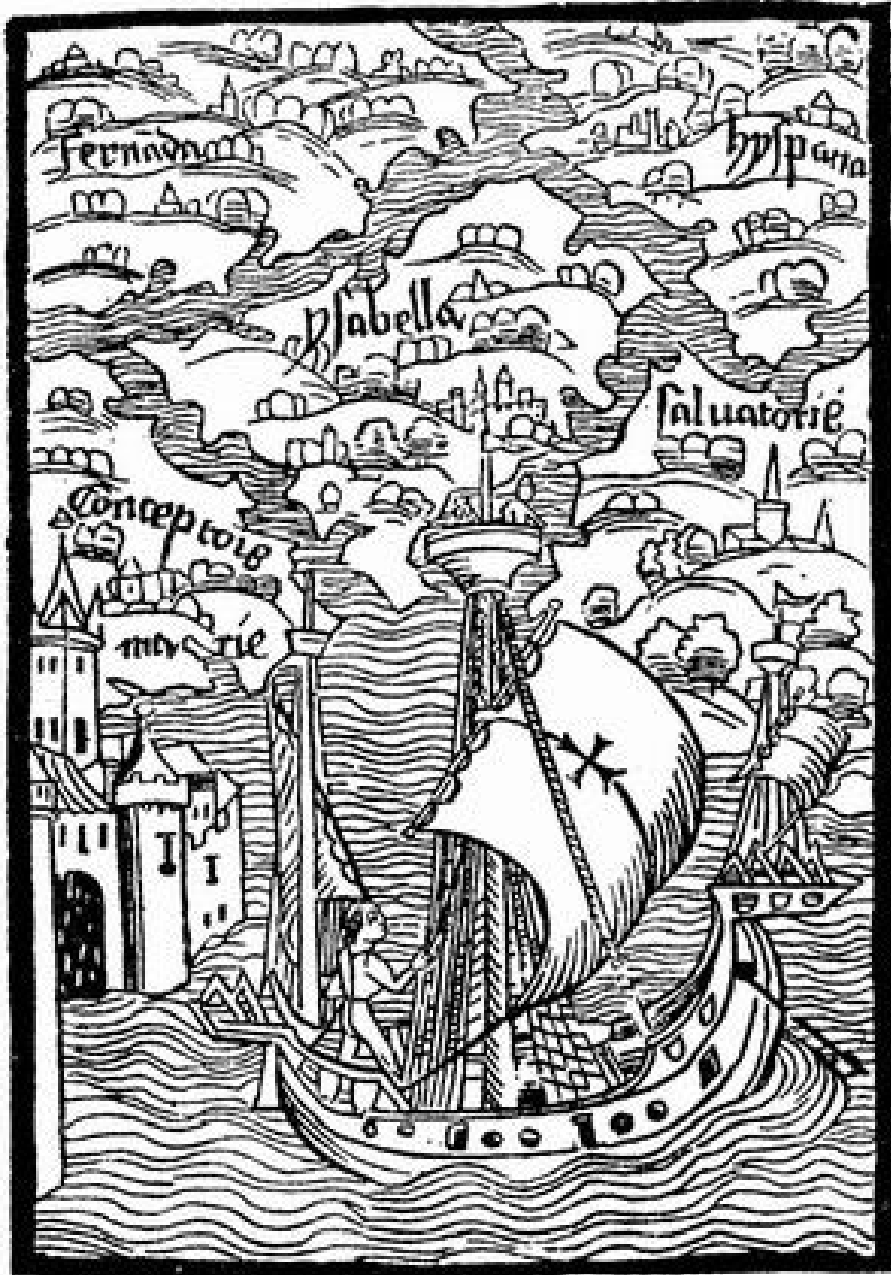
Imagen de las islas descubiertas. Xilografía de la edición latina del informe enviado por Colón a los Reyes Católicos (1493-1494).