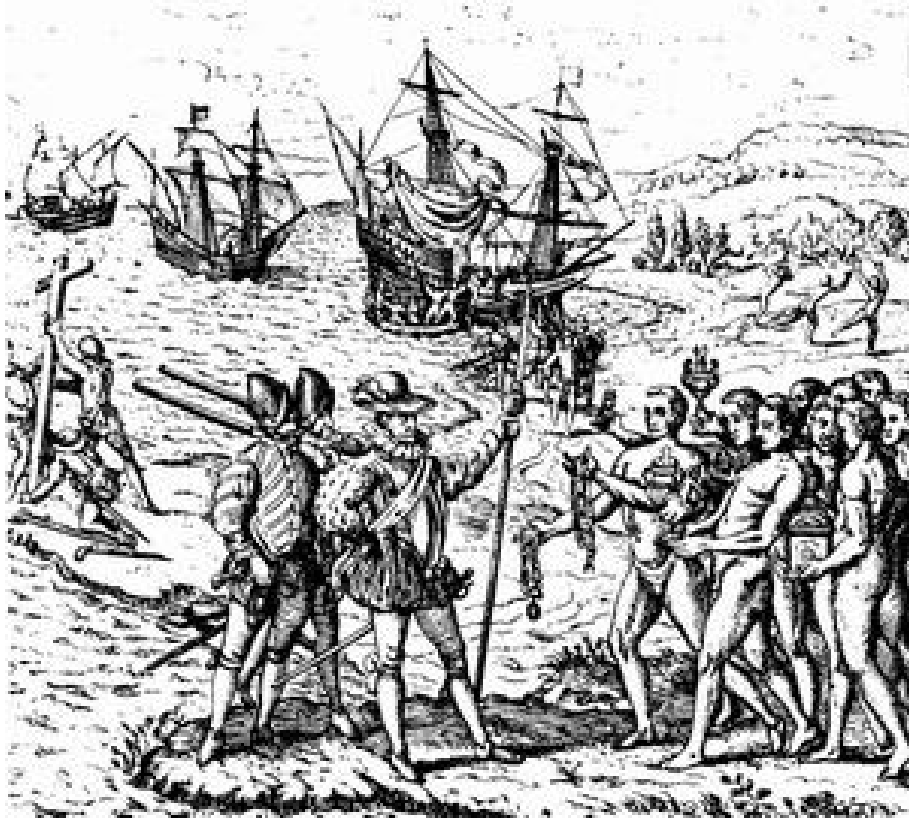
Desembarco de Colón, según un grabado del siglo XVII.