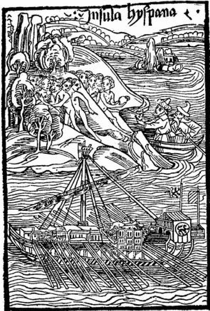
Desembarco en la Española. Xilografía de la edición latina citada.