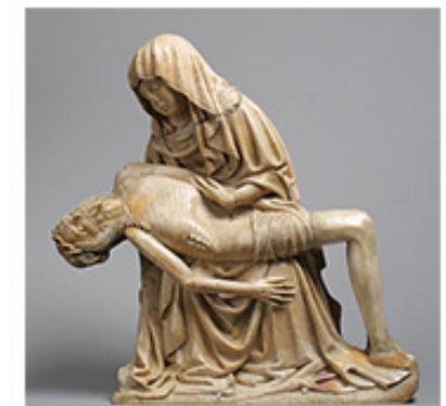
La maternidad divina de María – Catecismo de la Iglesia

18-19). Precisamente ahora se realiza el culmen del seguimiento: el discípulo no es más que el Maestro, y ahora experimenta toda la amargura de la cruz, de las consecuencias del pecado que separa de Dios, toda la absurdidad de la violencia y de la mentira. No se puede huir del radicalismo del interrogante planteado por la cruz: la cruz de Cristo, Cabeza de la Iglesia, y la cruz de Pedro, su Vicario en la tierra. Dos actos de un único drama: el drama del misterio pascual: cruz y resurrección, muerte y vida, pecado y gracia.