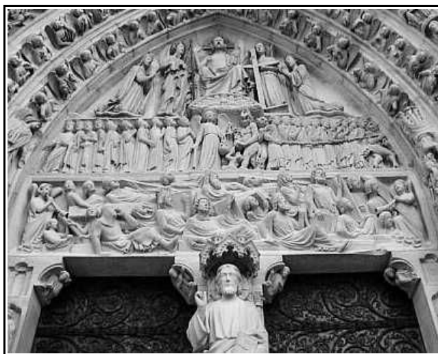
Fotografía del tímpano que le da nombre al pórtico central de la catedral de Notre-Dame: pórtico del Juicio. (París)

Vamos a intentar resolver estas dudas que se nos han planteado en el espíritu. Para ello, lo que hemos de hacer es desprendernos de todo prejuicio y de toda interpretación ajena a la que nosotros podamos llegar por nuestros propios medios... luego, cotejar el texto de Fulcanelli con nuestras investigaciones y, finalmente, extraer, en consecuencia, las pertinentes conclusiones.