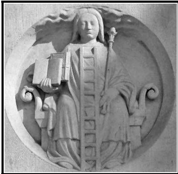
El Misterio de las Catedrales, París, I