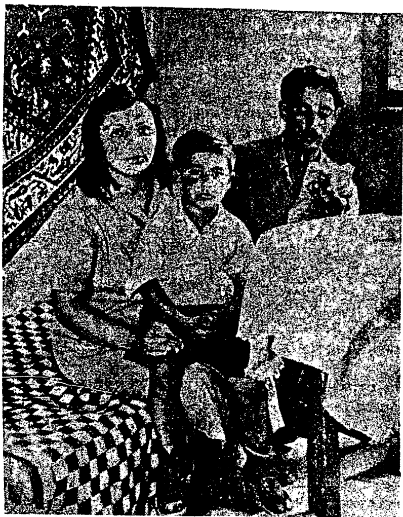
FAMILIA DE MARRANOS O SEA JUDIOS CLANDESTINOS DEL IBAN. EN PUBLICO SON PIADOSOS MUSULMANES Y EN SECRETO SON JUDIOS.

Fotografía tomada de la Monumental Obra Judía titulada "Enciclopedia Judaica Castellana. Tomo adicional titulado: "Judaísmo Contemporáneo". Publicado en 1961. México, D. F. Vocablo Marranos. Página 878 columna 1. MARRANISMO MODERNO.