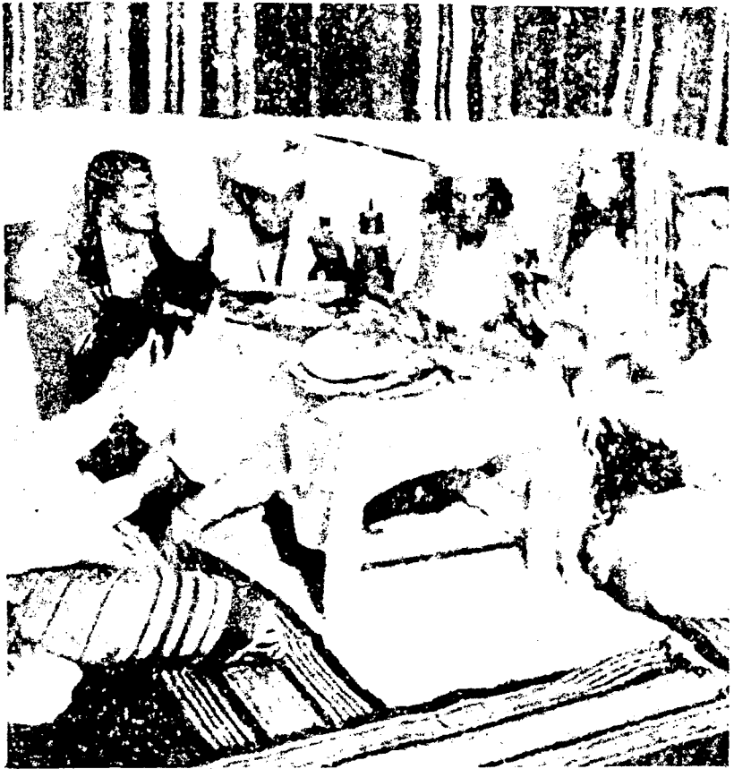
BANQUETE RITUAL FAMILIAR DE JUDIOS YEMENITAS DE LA CLASE MEDIA.

Las Ceremonias solemnes y los Ritos han dado y siguen dando al judaísmo una gran fuerza interna. Son de carácter sinagogaal o familiar, según se realicen en el seno de las Hermandades Sinagogaales o de la familia. Las ceremonias suelen terminar con un Banquete Ritual en el que cada plato y cada vianda tiene un significado simbólico. Los Banquetes Masónicos —son como casi todo en la Masonería— simples copias de los celebrados en el secreto del judaísmo. Para digestión de los gentiles los libros judíos llaman a veces COMIDAS FESTIVAS a los BANQUETES RITUALES para ocultar el verdadero significado en el judaísmo.