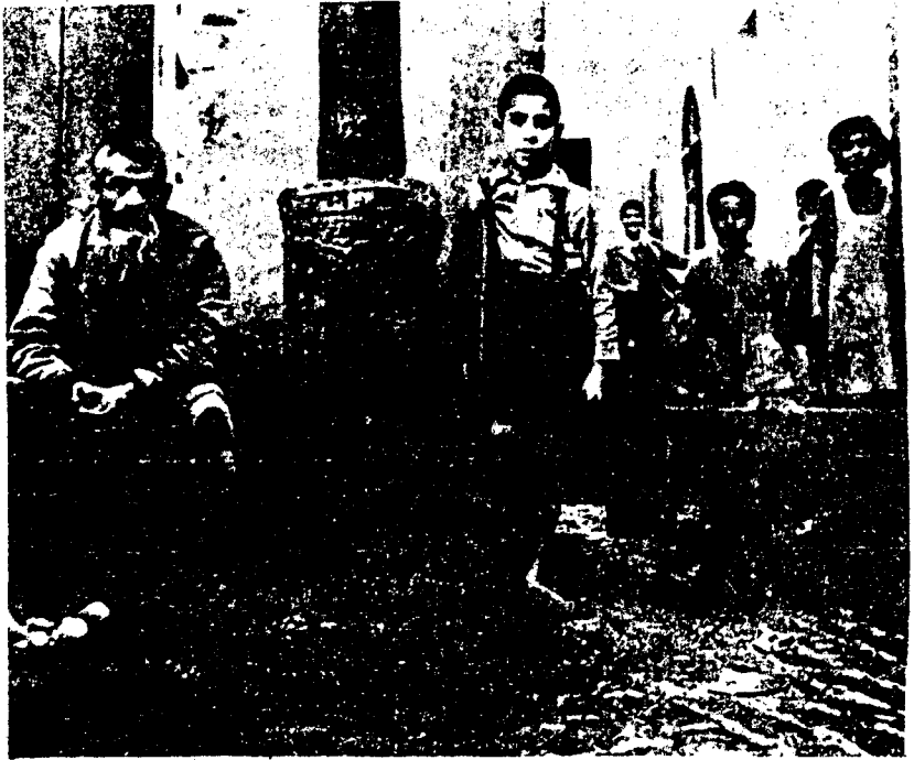
JUDIOS. POBRES DE CASABLANCA, MARRUECOS.

Fotografía tomada de la "Enciclopedia Judaica Castellana" Tomo VII., publicado en México, 1950. Vocablo Marruecos página 306.