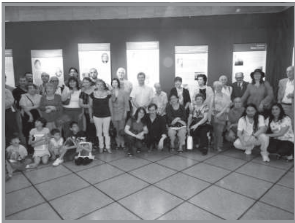
Investigadores y espiritas presentes - Día de cierre.