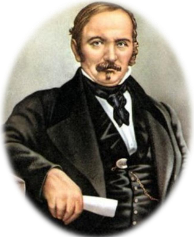
HIPPOLYTE LEÓN DENIZARD RIVAIL (ALLAN KARDEC) 1804 – 1869

presentaremos con gran honor la biografía de cada uno de estas y estos titanes de la verdad. Iniciamos esta sección con el reconocido Allan Kardec.