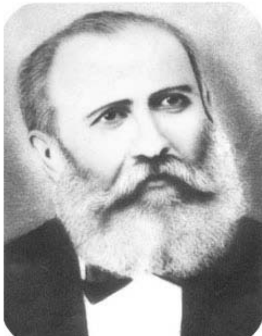
Dr. Adolfo Bezerra de Menezes (1831 - 1900)

¿Cómo podían los carrascos nazistas matar en el campo de concentración y, llegar en casa, sonrientes, afectuosos, buenos esposos y buenos padres?