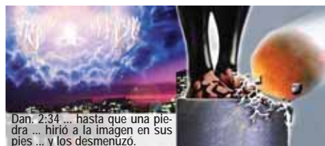
Dan. 2:34 ... hasta que una piedra ... hirió a la imagen en sus pies ... y los desmenuzó.

El profeta Daniel vio que en aquel tiempo cuando el hombre tratara de unir las Naciones de Europa y el mundo sería visitado cada vez más por catástrofes y guerras; una gran piedra chocará a la imagen en los pies y la destruirá por completo. Esa piedra representa la 2ª Venida de Jesucristo (Dan. 2:34-35, 44; Salmos 18:31). Cristo pronto volverá sobre las nubes del cielo con sus ángeles, visible para toda la humanidad (Ap. 1:7). Con el propósito de preparar a la especie humana para este evento y ayudarla a estar en pie durante el juicio; Dios, en su gran amor, advierte a la humanidad con un último mensaje de gracia que se encuentra en Apocalipsis 14:6-12.