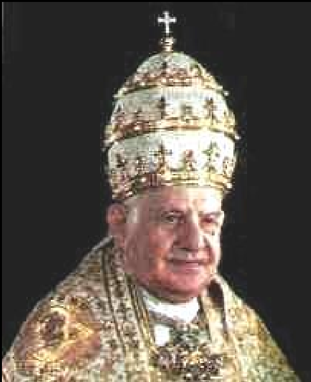
El Papa Juan XXIII usando una triple Tiara