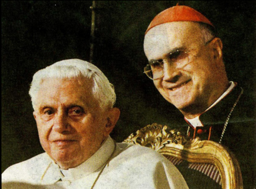
Benedicto XVI y Tarcisio Bertone.