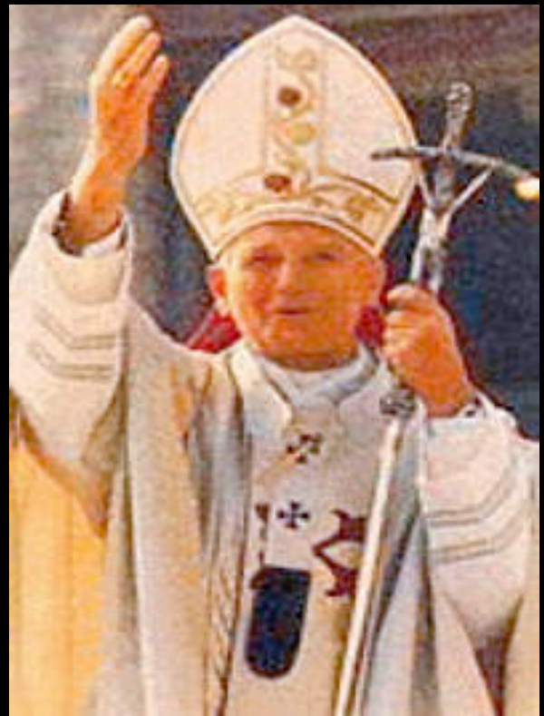
El Papa Juan Pablo II usando la Mitra Papal