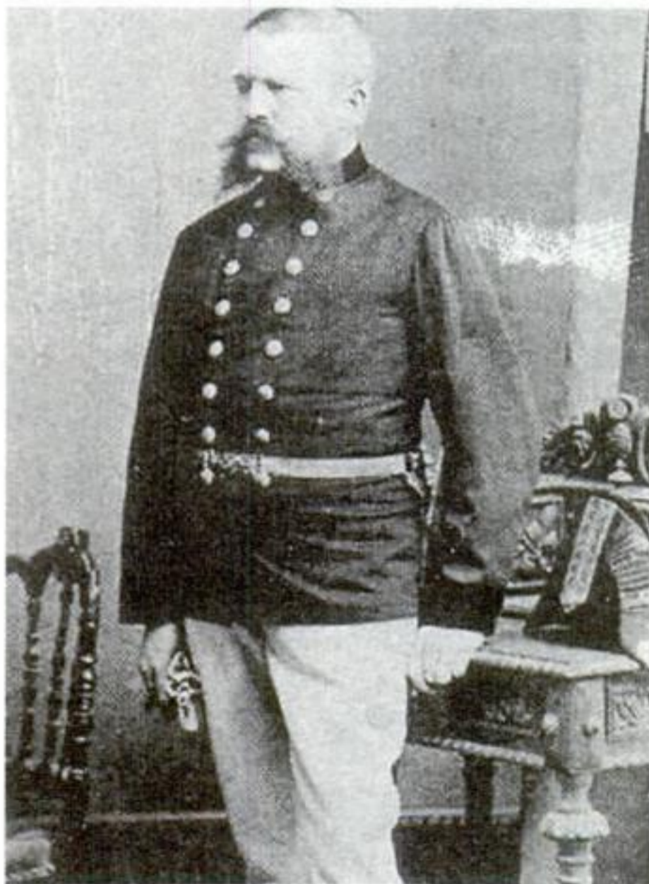
Alois Hitler, padre del dictador nazi.

Efectivamente, acerca de los padres de Hitler hay muchos mitos y algunos datos curiosos. Adolf nació el 20 de abril de 1889. Para entonces, el matrimonio formado por Alois Hitler (el tercero para él) y Klara Pölzl (el primero para ella) tenía ya tres hijos. Se trataba de Gustav, Ida y Otto, nacidos en los años inmediatamente anteriores a Adolf. Los seguirían Edmund y Paula. Además, tenía dos hermanos de padre, Alois y Ángela, nacidos del segundo matrimonio de Alois. El apellido del pa-