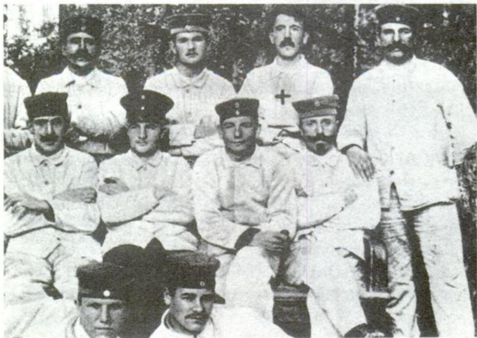
Hitler, señalado en la imagen con una cruz, posa con sus compañeros convalecientes en el hospital psiquiátrico de Passewalk.

Lo que sí sabemos es que el 15 de octubre de 1918 Adolf Hitler es gaseado con hiperita en el frente de Flandes. Sufre quemaduras y ceguera, siendo repatriado e internado en el hospital militar de Passewalk, cerca de Berlín. Allí lo curan y recupera normalmente el uso de sus ojos. Pero el 11 de noviembre de 1918 el capellán del hospital anuncia a la vez la noticia del armisticio y la revolución que estalla en Berlín. Sobrecogido por un raptó de desesperación, Hitler se vuelve a quedar ciego. La intensidad inesperada de esta desesperación y la vuelta de