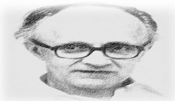
Ivan Boszmormenyi-Nagy Ivan Boszmormenyi-Nagy