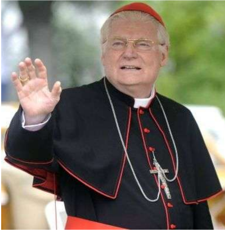
ANGELO SCOLA PEDRO II (el romano)