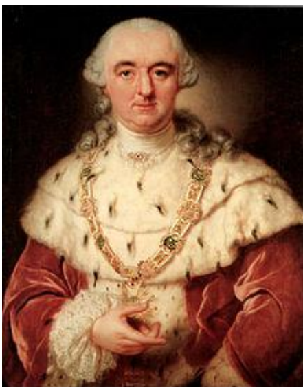
Carlos II Teodoro de Baviera

Durante las disputas internas las asociaciones secretas habían atraído sobre sí la atención de las autoridades bávaras. Eran el blanco de sospechas de asesinatos afines a la ilustración, que pretendían alterar el orden tradicional, infiltrándose entre los funcionarios públicos para alcanzar un «Estado razonable».