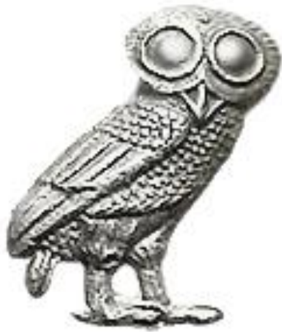
Símbolo de la orden: el mochuelo de Minerva.

Aparte de esto, el fundador vio en la Orden Rosacruz, una orden mística espiritual perteneciente a la masonería, un mal siempre creciente que debía combatirse. Weishaupt informó de sus razones para la fundación de la sociedad en su carta Pythagoras oder Betrachtungen über die geheime Welt- und Regierungskunst . La orden tomó un primer impulso en 1778 cuando un antiguo alumno suyo y presidente del Palatinado Renano la reorganizó. Weishaupt propuso como nuevo nombre Bienenorden, la 'Orden de las abejas', porque se imaginaba que los afiliados deberían recopilar el néctar de la sabiduría dirigidos por una abeja reina, pero al final se prefirió Bund der Illuminaten ('Unión de los Iluminados') y después, Illuminatenorden ('Orden de los Iluminados'). De la asociación de sapiencia se crearía ahora una