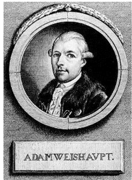
Adam Weishaupt, el fundador.

Para ofrecer protección a los alumnos de las intrigas jesuíticas, que presuponía por todas partes, pero sobre todo para proporcionarles acceso a literatura crítica eclesiástica contemporánea, fundó la «Asociación de sabiduría secreta», en cuyos comienzos no era más que un círculo de lectores anticlericales de un máximo de veinte miembros.