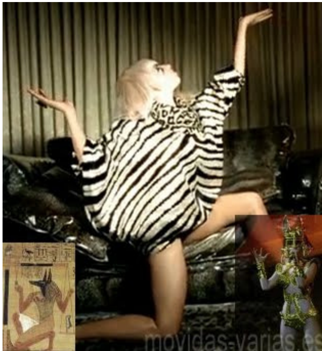
Lady Gaga adopta la posición de Isis en el vídeo Just Dance.

Según la mitología egipcia el ojo derecho de Horus era blanco y representaba al sol, su ojo izquierdo era negro y representaba a la luna. Horus perdió su ojo izquierdo luchando contra su hermano Seth.