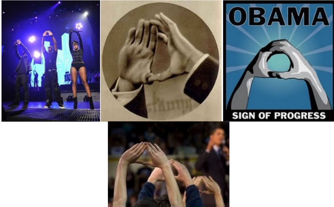
Foto1: Rihanna en un concierto de su expareja Jay Z, haciendo el símbolo de la pirámide con sus manos