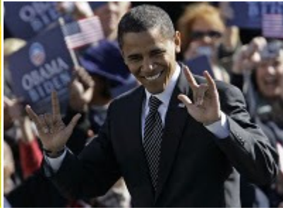
Foto1: Rihanna y Lady Gaga, esclavas mentales Mk-ultra adorando a su Dios de un solo ojo Fotos 2 y 3: Rihanna y Obama haciendo el símbolo masónico de "el Cornuto", que simboliza el veneno y oro.