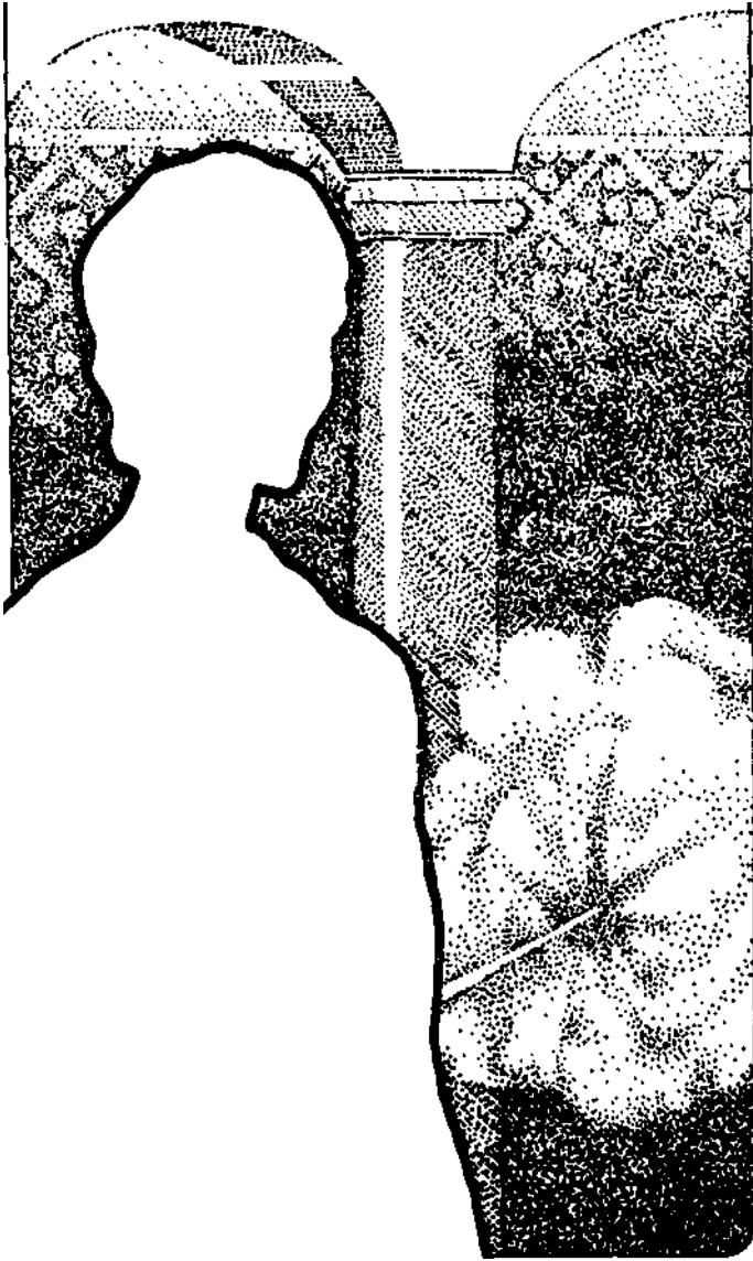
Expulsión de la Substancia Astral