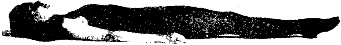
LA POSTURA DE TIERRA