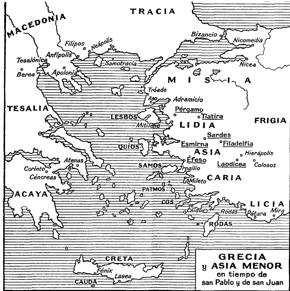
GRECIA y ASIA MENOR en tiempo de san Pablo y de san Juan