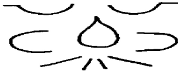
Fig. 9: Emzhebyp-el noveno líder de la esfera de la luna, es el ángel guardián especial de las personas cuya enfermedad es debido a influencias desfavorables de la luna o por los hechos de los espíritus negativos de la esfera de la luna. Este es usualmente el caso con ataques de epilepsia, menstruaciones difíciles, estados de obsesión, histeria, St. Vitus's Dance, locura, etc. Este líder revela al mago como curar tales enfermedades por fuerza de la luna mágica.