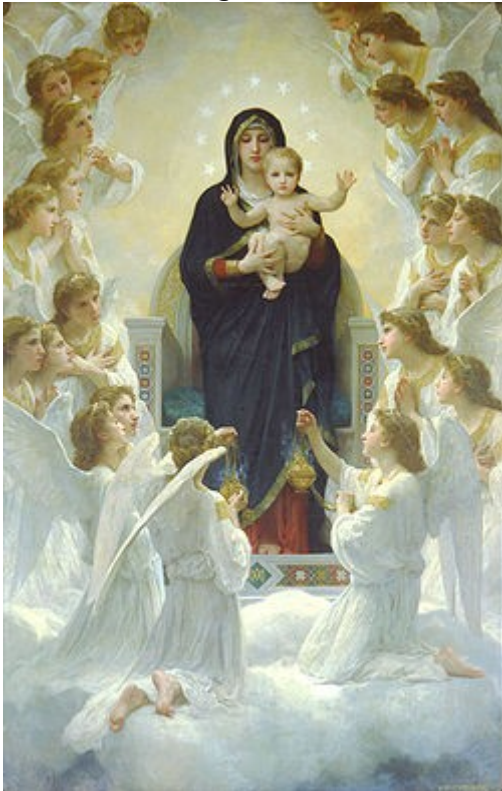
La Virgen María (madre de Jesús) con ángeles. William-Adolphe Bouguereau , (1900).

Un ángel es un ser etéreo presente en las creencias de muchas religiones cuyos deberes son asistir y servir a Dios . Según las tres principales religiones monoteístas , los ángeles actúan típicamente como mensajeros. Más específicamente, en el Cristianismo , el término ángel hace referencia a la categoría más inferior de las nueve en que tradicionalmente se dividen los seres angélicos. La rama de la teología que se ocupa de los ángeles se denomina angelología.