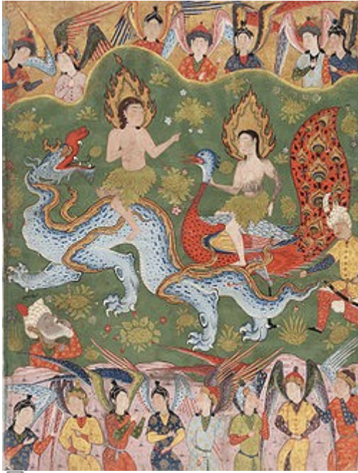
Adán y Eva rodeados de ángeles en una miniatura persa de hacia 1550 .

Como religión emparentada estrechamente con el cristianismo y el judaísmo, en el Islam también existe la creencia en los ángeles, que en lengua árabe reciben el nombre de ملاك , malāk (plural ملائكة , malā'ika ), de la misma raíz que el hebreo מלאך , malākh o malāj .