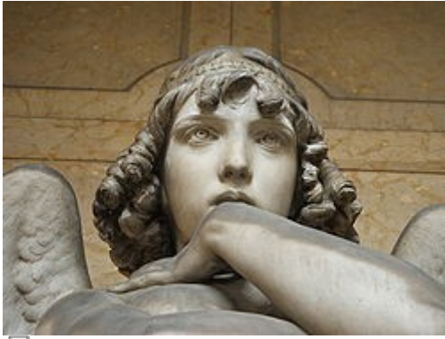
Estatua del ángel de la resurrección. Giulio Monteverde , Génova .