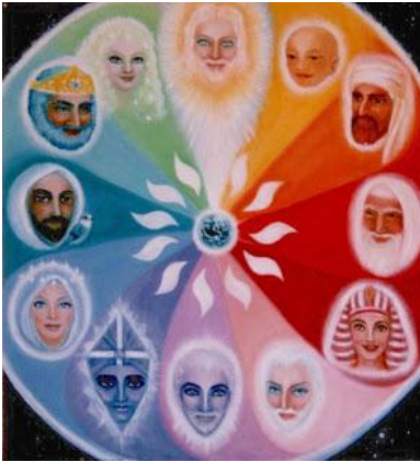
Los llamados "Maestros Ascendidos" o "Hermandad Blanca"