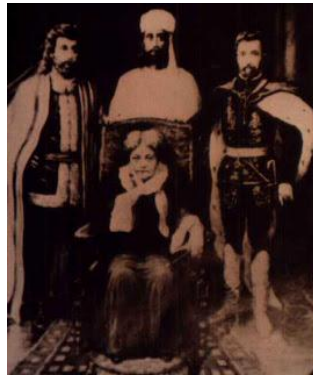
Supuesto retrato de Helena P. Blavatsky y los Maestros Ascendidos (Kuthumi, El Morya y Saint Germain)