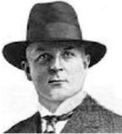
V.M. Huircocha Arnold Krumm Heller. Arzobispo de la Iglesia Gnóstica y Fundador de la Fraternidad Rosacruz Antigua.