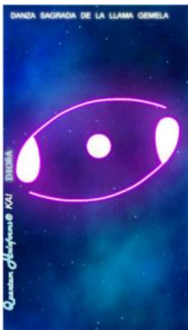
Danza sagrada: Armoniza tu femenino y masculino