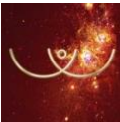
Sías Sana energía Femenina