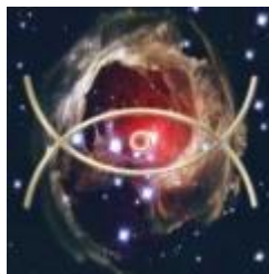
Elta Sana energía Masculina