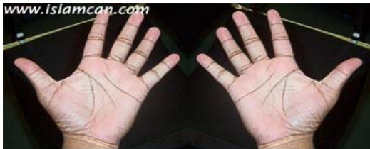
Look at your hands and identify the outlined marks.

Hoy día, cada año, los israelíes celebran el purim masacrando palestinos y constantemente en sus clínicas abortivas asesinando niños blancos.