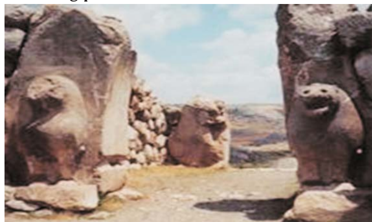
Ruinas de Hattusa en Bogazkoy

kaska fueron incorporados al imperio, que incluía, buena parte de Chipre y diversos territorios en Siria, donde el reino hitita limitaba al este con Asiria y al sur con Egipto.