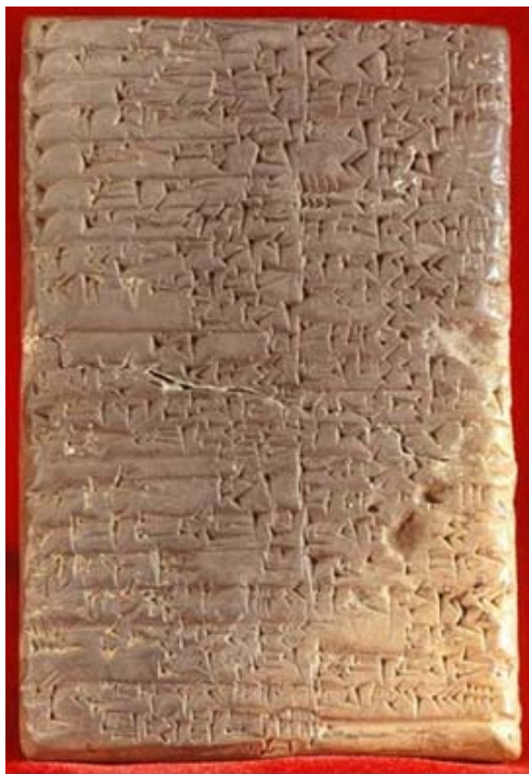
Escritura cuneiforme sumeria

"Dos desarrollos realizados durante los años 1950 permitieron una mejor comprensión de la literatura sumeria. En Chicago Landsberger estaba editando material para el Sumerian Lexicon. En Filadelfia, Samuel Noah Kramer estaba ocupado poniendo a disposición de los estudiosos tantas tablillas como fuera posible de las colecciones de Filadelfia, Istambul y Jena."