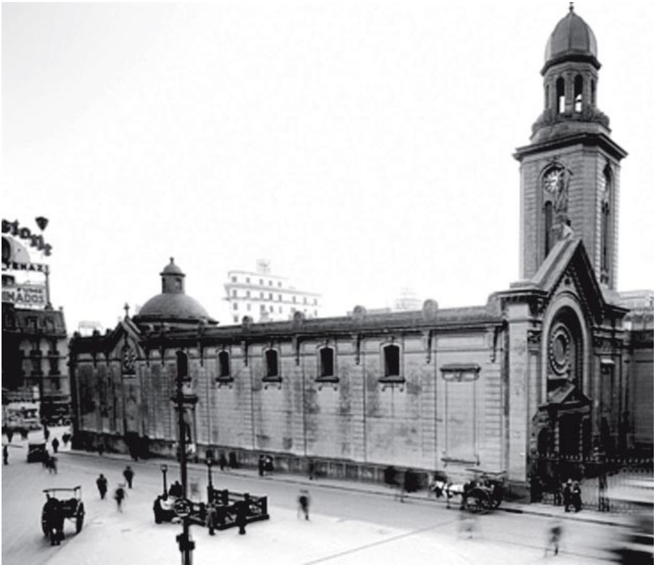
IGLESIA SAN NICOLAS DE BARI. FUE DEMOLIDA EN 1936 PARA TRAZAR LA 9 DE JULIO Y HOY EN SU LUGAR SE ERIGE EL OBELISCO.