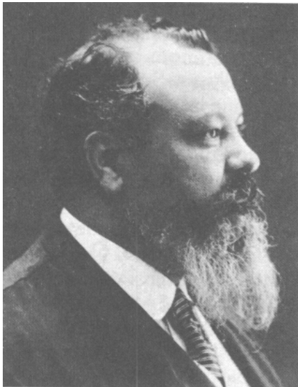
El Dr. Gérard Encausse o Papus