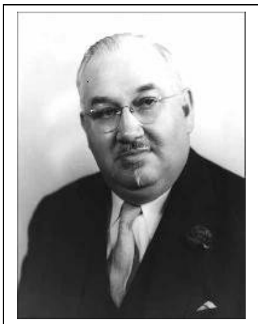
El Dr. Harvey Spencer Lewis

En París, se formaron varios grupos independientes pero no hubo realmente un Consejo Supremo reconocido como tal por el conjunto de los Martinistas. De hecho, la mayoría de los Martinistas, más que lanzarse a luchar por la sucesión, prefirieron continuar trabajando en la sombra, quedando aislados.