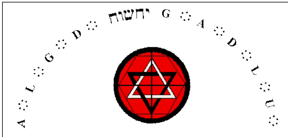
Símbolo de la Orden Martinista