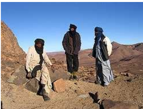
🏠 Tuaregs de Argelia .

Los tuareg o imuhagh son un pueblo bereber o amazic en el desierto del Sáhara , cuando se desplazan cubren las necesidades de los animales y las suyas propias en el camino, puesto que viven en unidades familiares extensas las cuales van siguiendo a los grandes rebaños a su cargo. Tienen su propia escritura , el tfinagh .