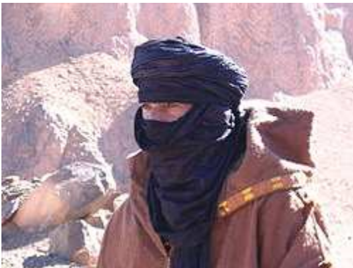
📷 Pastor tuareg en el desierto.

Los pastores libres imɣad ( imghad plural; amghid singular) son propietarios de cabras y algunos camellos. En el Ahaggar son llamados kel ulli , ‘los de las cabras’. En algunos lugares tienen también ovejas e incluso bovinos y les corresponde pastorear también los rebaños de los aristócratas de su ettebel , de los cuales se consideran vasallos . Algunos linajes de pastores son mestizos iregeynatan (singular arageyna ) y se les considera también libres aunque con un estatus propio. 1